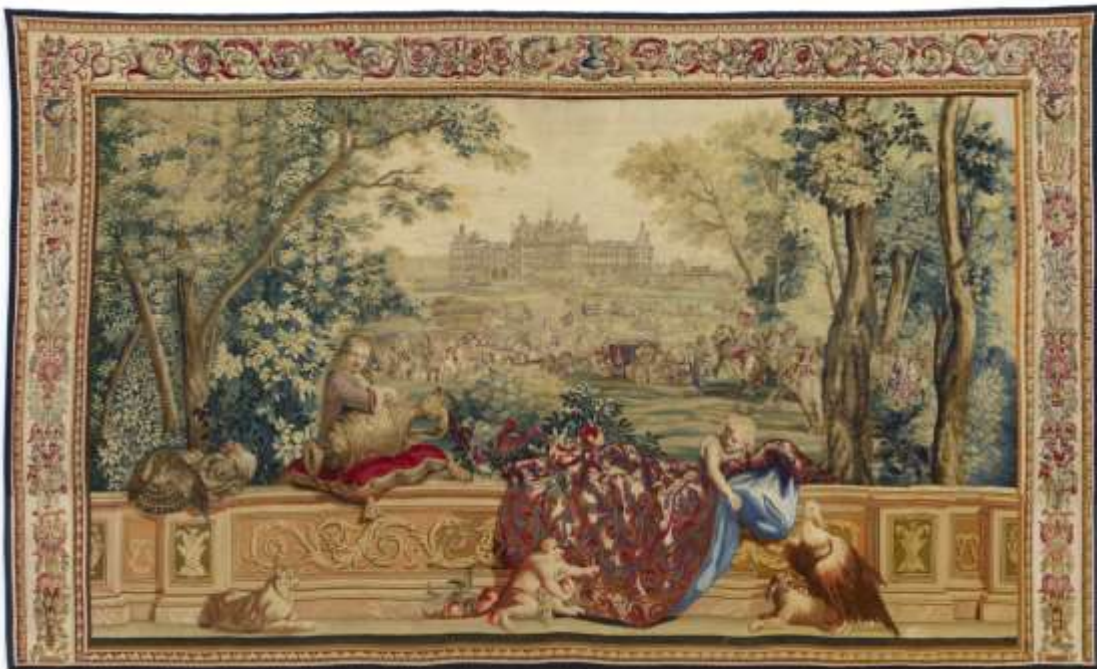
Septembre. Chambord. La marche du Roi Manufacture royale des Gobelins 1 er quart du XVIII e siècle Laine et soie Domaine national de Chambord, achat 2012