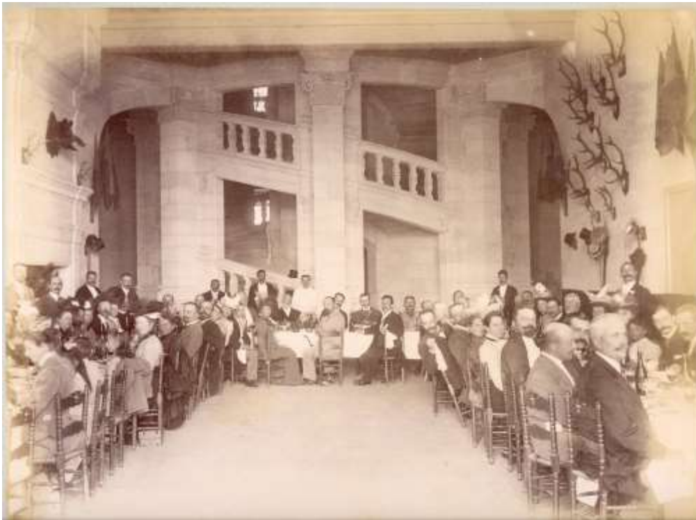
Lunch offert, le 11 août, par la Presse Blésoise, dans la salle des gardes Paul Rochas 1900 Epreuve sur papier albuminé contrecollé Domaine national de Chambord, achat 2014