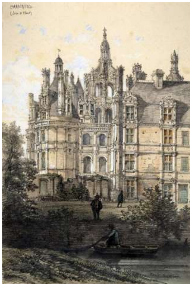
Septembre. Chambord. La marche du Roi Manufacture royale des Gobelins 1er quart du XVIII e siècle Laine et soie Domaine national de Chambord, achat 2012