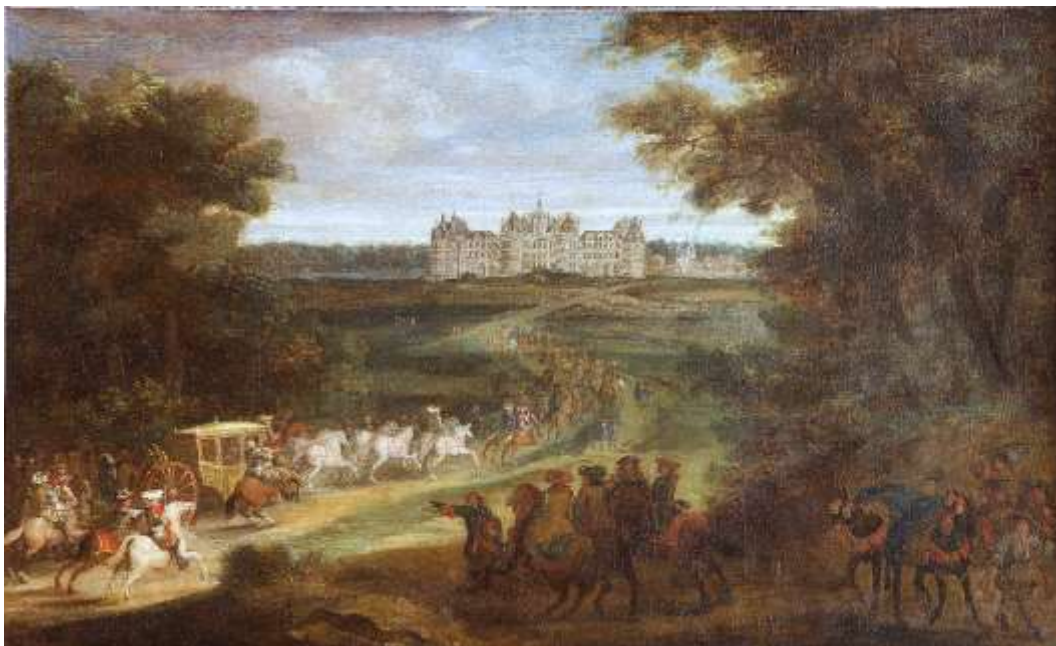
L'arrivée de Louis XIV à Chambord Frans Adam van der Meulen (1632-1690) 3 e quart XVII e siècle Huile sur toile Domaine national de Chambord, achat 2015.