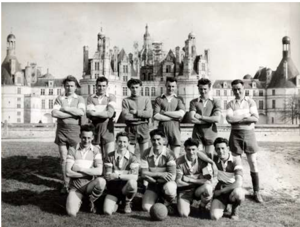
L'équipe de football de Chambord Anonyme Vers 1950 Photographie Domaine national de Chambord, don J.-J. Boucher 2011