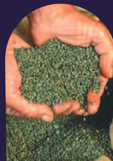
Terre paysanne, terre nourricière.