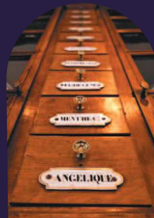
Terre de charité.