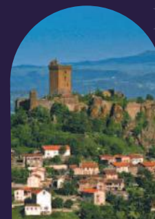
Édifices de pierres, pierres d'édifices.