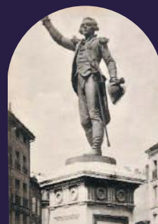
Le Velay par mots et par vaux.