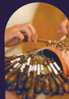
Dentelle et savoir-faire.