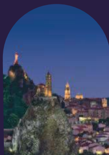
Une ville sanctuaire.