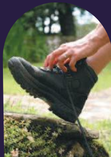
À la croisée des chemins.