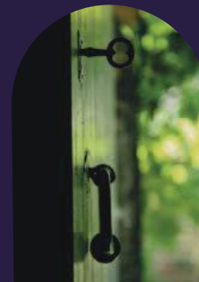
Terre d'hospitalité et d'accueil.