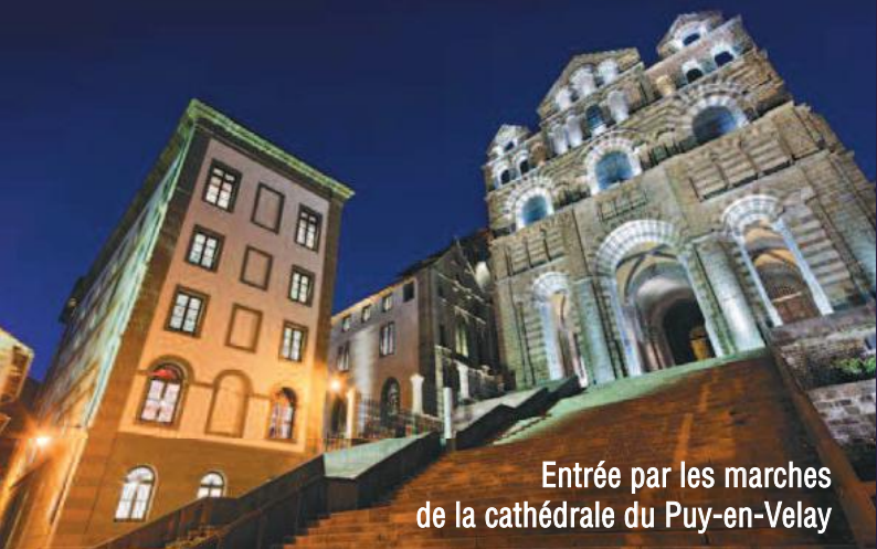
Entrée par les marches de la cathédrale du Puy-en-Velay

Patrimoine vivant renouant avec sa vocation historique d'hospitalité et de rencontre, l'Hôtel-Dieu est le monument classé par l'UNESCO au patrimoine mondial de l'Humanité au titre des chemins de Saint-Jacques-de-Compostelle.