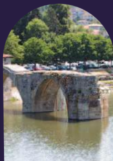
Eaux sauvages, eaux domptées.