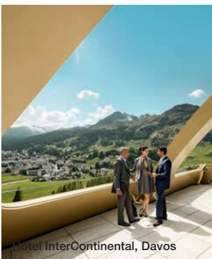
Hotel InterContinental, Davos