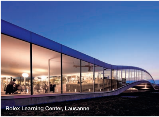
Rolex Learning Center, Lausanne