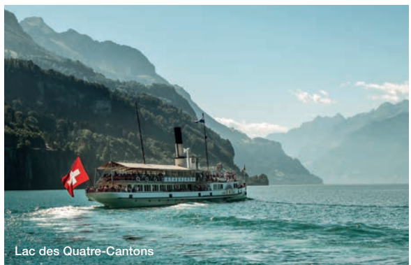
Lac des Quatre Cantons