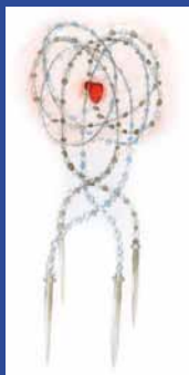
Le Cœur de l'Hôtel-Dieu, 2012 Aquarelle sur papier © Jean-Michel Othoniel

C'est Le Cœur de l'Hôtel-Dieu de Jean-Michel Othoniel qui est retenu à l'automne 2011.